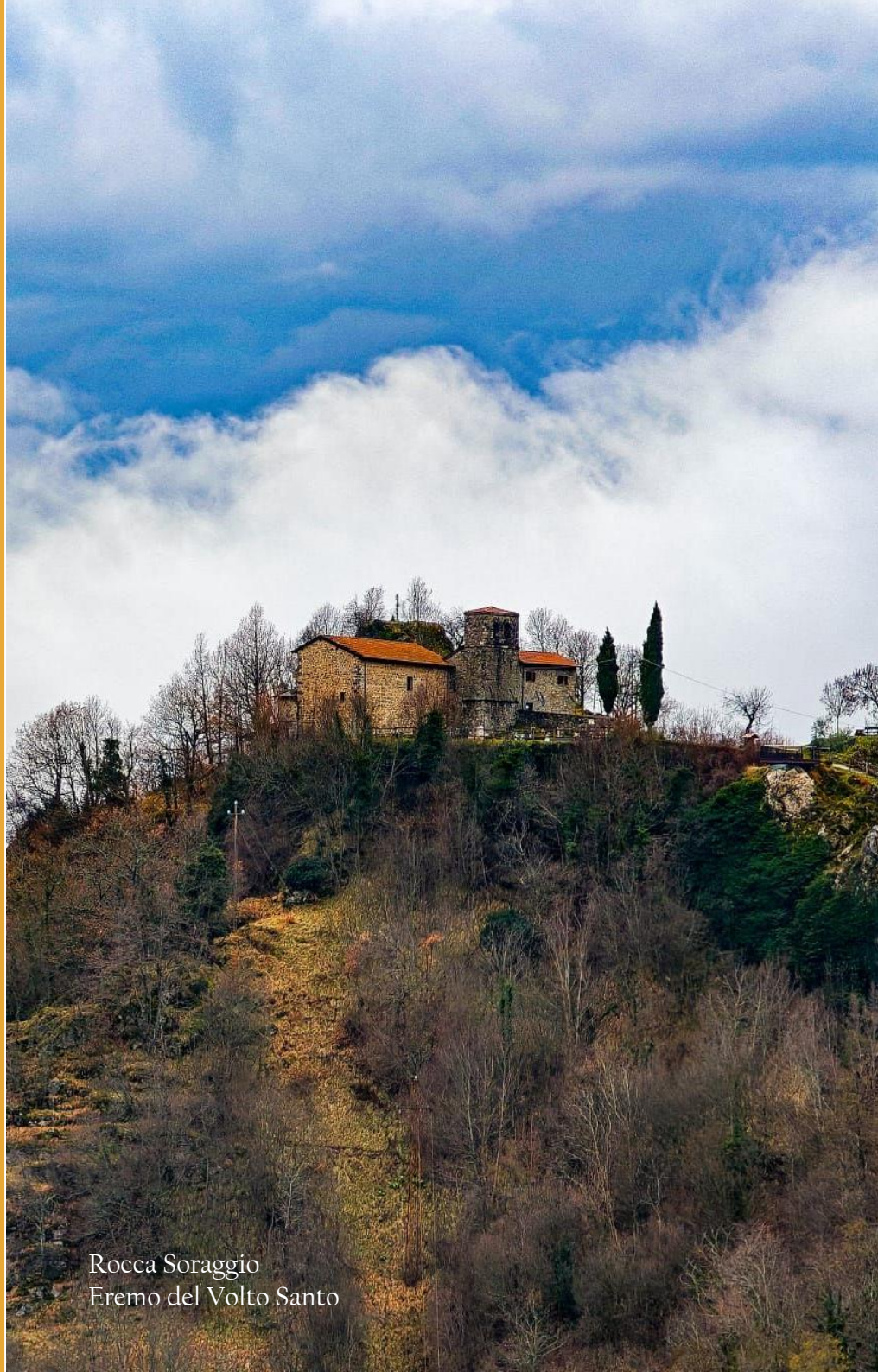
Rocca Soraggio Eremo del Volto Santo